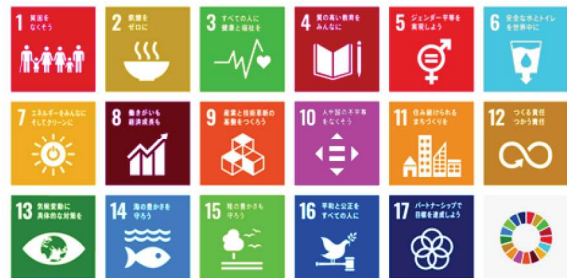
SDGs の 17 のゴールを示すアイコン

SUSTAINABLE DEVELOPMENT GOALS SDGs ロゴマーク