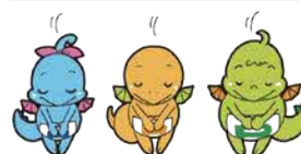
リリー・ミリー・ドリー 足立区温暖化対策キャラクター