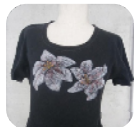
ハギシのフローチ ネクタイのトートバッグ Tシャツのステンシル