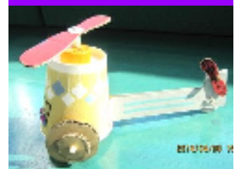
紙コップ・ヘリコプター