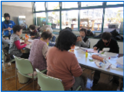
牛乳パックのカードケース

牛乳パックを切り取る作業に時間をかけて、丁寧に切り取りました。和紙を貼る作業では、それぞれの図柄を楽しみながらきれいに貼る事ができました。予定の時間より早めに仕上がり、とても喜んでいただけました。