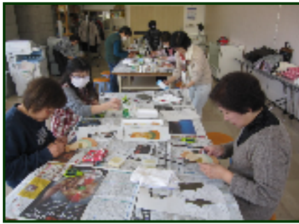
トールペイント 干支の壁飾り

今年の干支の蛇のデザインの壁掛けのため、楽しみにしていたという方がいらっしゃいました。蛇の形にカットした板に何層にも色を重ねる細かい作業でしたが、筆遣いなど先生からの詳しい説明や指導をしていただきました。