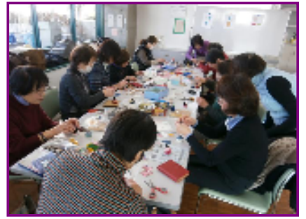
木の実で作る雛飾り

季節を先取りした雛人形の講座で、参加者も楽しそうに作業を行っていました。先生の丁寧な指導のおかげで、ハギレを貼り付ける細かい作業もスムーズに進み、それぞれ可愛い作品を作り上げられました。