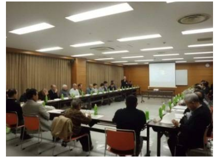
まちづくり連絡会の様子