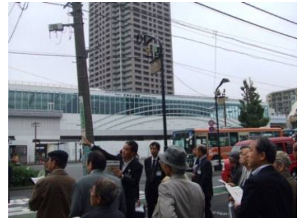
先進事例視察の様子 (石神井公園駅南口にて)