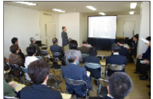
鎌ヶ谷市役所にて (先進事例視察会の様子)