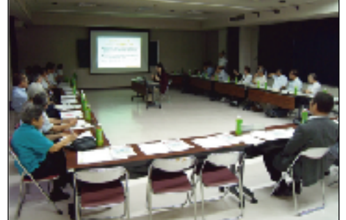
第21回まちづくり連絡会の様子