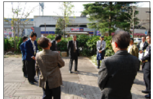
東武野田線鎌ヶ谷駅駅前広場にて (先進事例視察会の様子)