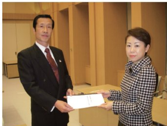
■菅原副知事に要望書を手渡す区長 （平成19年10月31日）