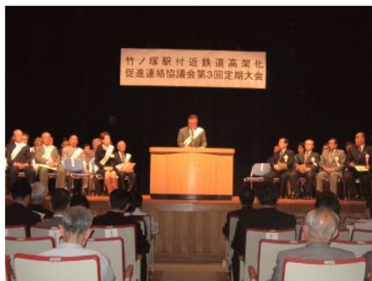
■竹ノ塚駅付近鉄道高架化促進連絡協議会 第3回定期大会（平成19年10月15日）

この協議会は、地元町会自治会・区議会議員・地元選出議員等で構成され、鉄道高架化の一日も早い実現に向けて定期大会を開催しました。