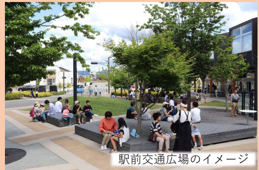
駅前交通広場のイメージ