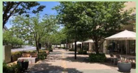
空間づくりのイメージ▲