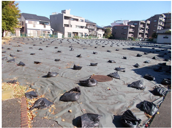
9 (旧) 中央本町プール