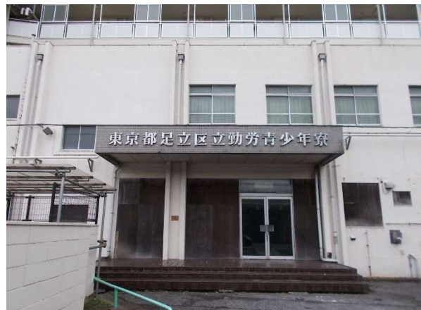
2 (旧) 勤労青少年寮