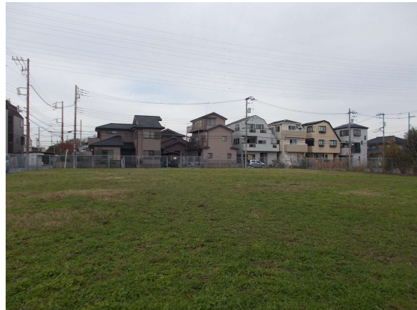
22（旧）（仮称）花畑二丁目住区センター用地