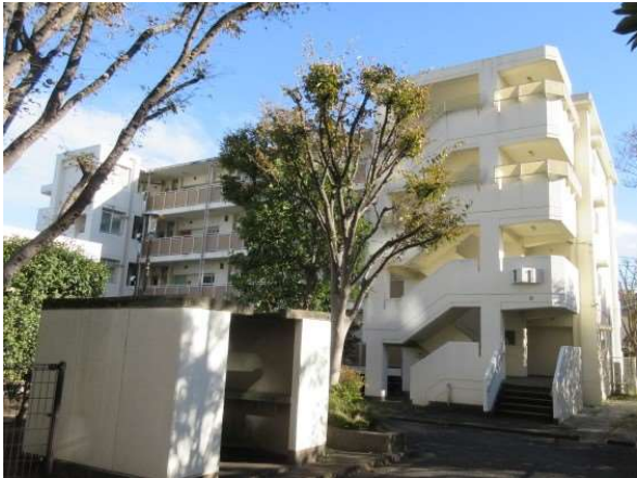
16 大谷田一丁目第2アパート