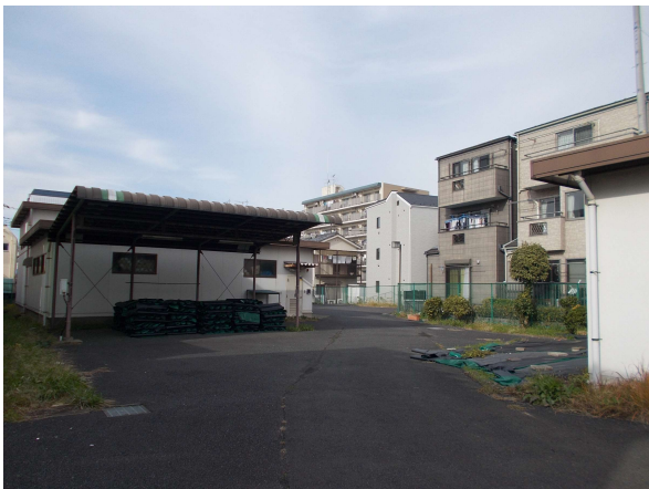
5 (旧) 綾瀬器材置場