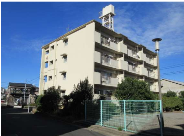
18-1 大谷田二丁目アパート (4号棟)