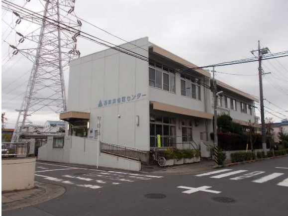
14 西新井住区センター