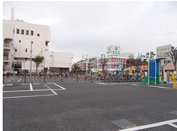
4 (旧) 教育相談センター