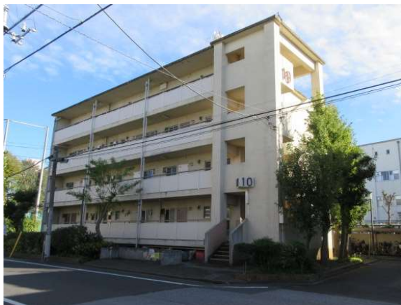
19 大谷田二丁目アパート（10号棟）