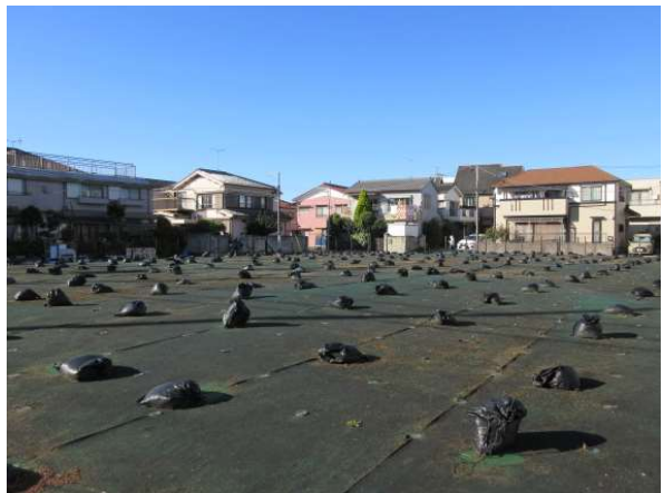
11 (旧) 大谷田二丁目第2アパート