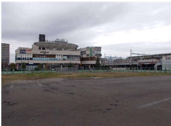
21 千住大橋駅周辺まちづくり用地