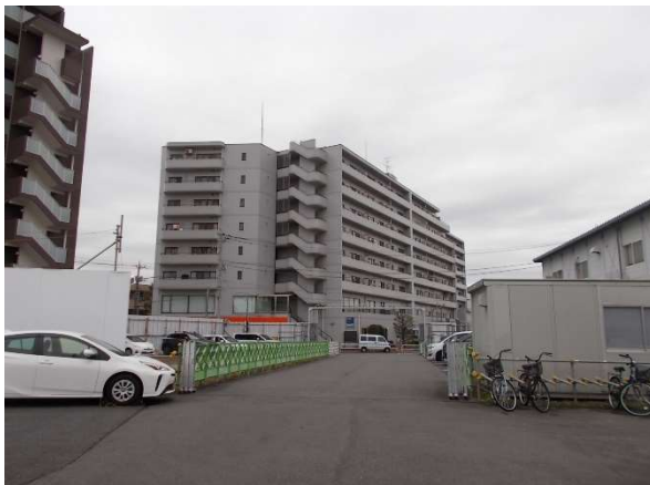
3 (旧) 竹の塚保健総合センター