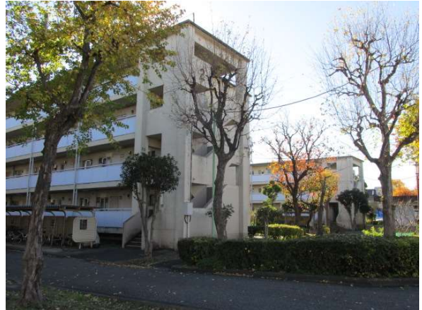
15 新田二丁目アパート