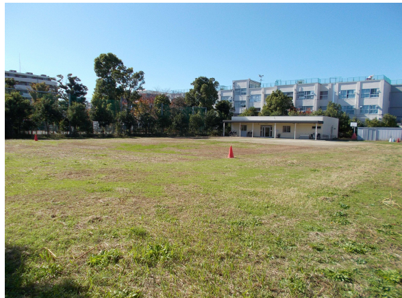
20 弥生小学校（拡張用地）