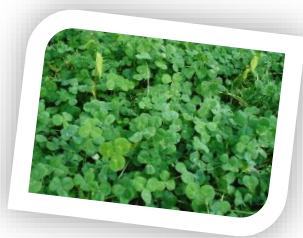
↑こども園のクローバーが育っています（5月15日撮影）