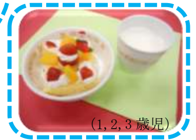
(1, 2, 3歳児)