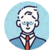
高齢者支援団体代表者

子育て家庭の支援をしています。センターに登録したことで、子ども食堂への食材支援を受けられるようになりました。また交流会への参加などを通じて、他団体とのつながりも広がっています。