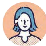
子ども食堂主催者

子育て家庭の支援をしています。センターに登録したことで、子ども食堂への食材支援を受けられるようになりました。また交流会への参加などを通じて、他団体とのつながりも広がっています。