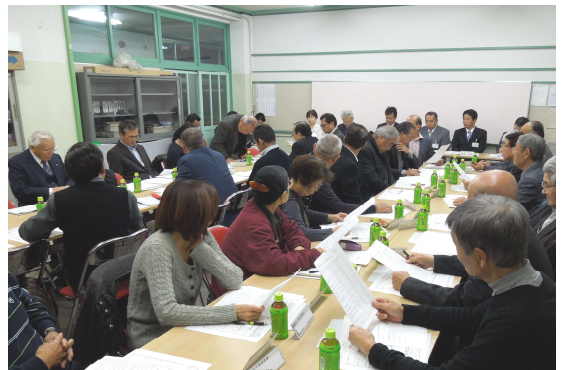
第1回綾瀬駅東口周辺地区まちづくり協議会の様子