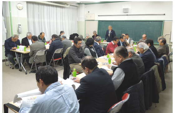
第2回綾瀬駅東口周辺地区まちづくり協議会の様子