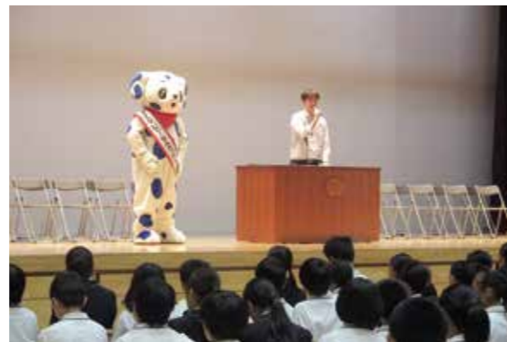
鹿浜菜の花中学校で講義する足立区選挙管理委員会事務局職員とエラビ→

また、講義を行った中学校や一部の中学校では、選挙をより身近に感じてもらうため、実際の投票所で使用している投票用紙記載台や投票箱などの選挙機材を貸出し、生徒会役員選挙が行われました。