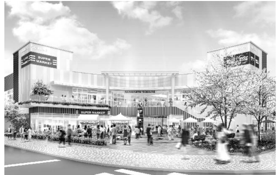
◆提案内容イメージ図

※ 提案内容は、事業者決定時のものであり、今後の協議等により一部変更となる場合があります。