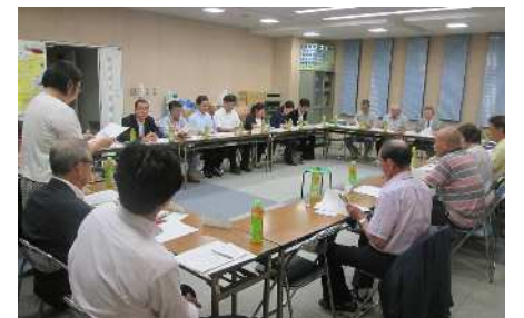
第17回まちづくり協議会の様子

平成27年9月18日に協議会を開催し、区、UR都市機構、I2街区事業者から、花畑五丁目地区地区計画の変更、毛長公園・毛長川沿いのまちづくりの検討の進め方、毛長川沿い区道の不法投棄対策の経過、団地再生事業の進捗状況、花畑保育園の新園舎近隣住民への説明会開催結果について報告され、これらに関し意見交換を行いました。