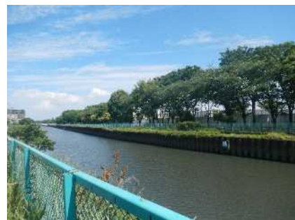
毛長川の景観(草加市側から)

なお、アンケート調査の結果は、花畑団地周辺地区まちづくりニュース第16号(予定)にてご報告いたします。