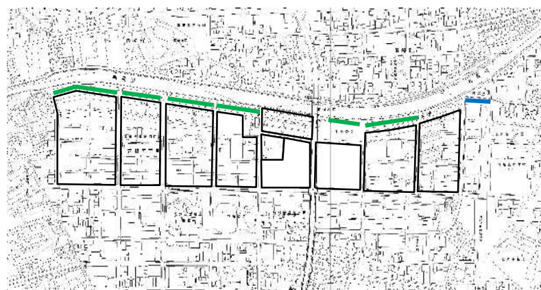
— ガードパイプ設置箇所 — ポストコーン設置箇所