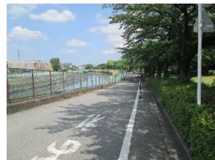
毛長公園北側の道路