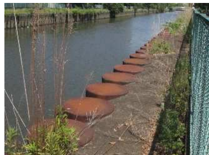
毛長川の鋼管杭(上面)