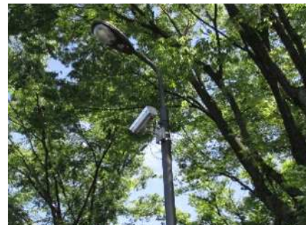
毛長公園の防犯カメラ