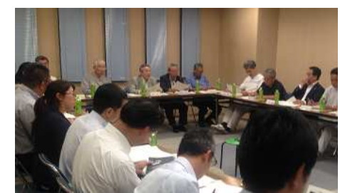
第 16 回まちづくり協議会の様子

平成 27 年 6 月 24 日に協議会を開催し、区、UR 都市機構、I 2 街区事業者から、A・B 街区周辺のまちづくり、毛長川沿い区道の不法投棄対策について、バス経路の見直し、I 2 街区の計画について、UR 都市機構団地再生事業の進捗状況について報告され、これらに関する意見交換を行いました。