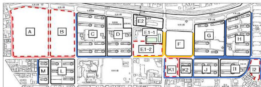
歩道拡幅整備工事図