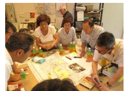
班ごとに意見交換