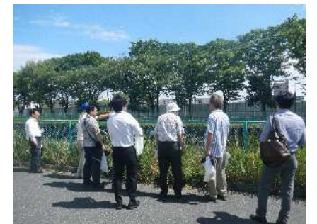
まちあるきの様子