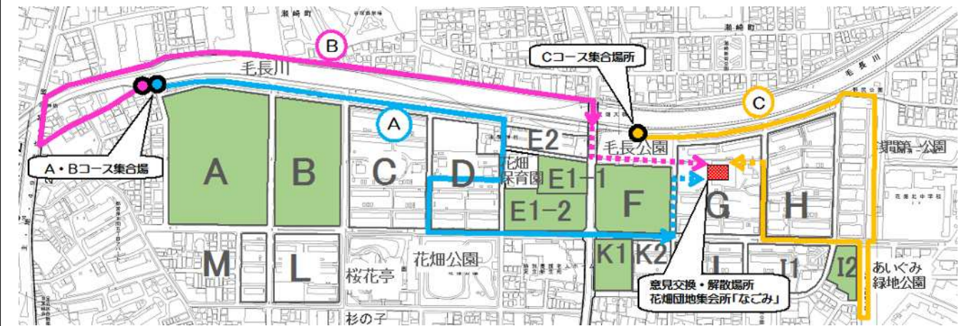
まちあるきルート図

当日は、晴天のもと3つのグループに分かれて、1時間程それぞれのコースを歩き、花畑団地周辺の道路や緑などの状況を確認しました。