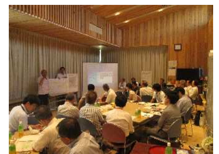
班ごとの発表、全体でのまとめ

今後は、まちあるきで出された意見を参考にしながら、大学開設時期を見据えて、さらに魅力ある花畑地区となるようまちづくりを進めていきます。