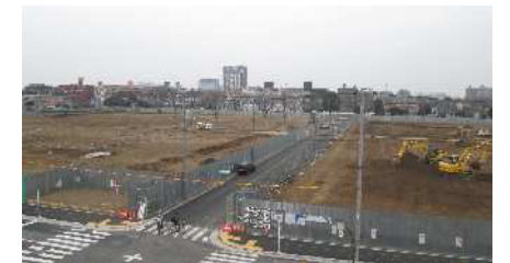
花畑団地A・B街区の様子

また、今後のまちづくりを検討するにあたり、団地周辺の現状確認のため5月31日に「花畑まちあるき」を行いました。