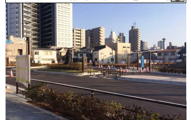
千住大橋駅前交通広場

国道4号から開発拠点地区と千住大橋駅へ繋がる道路が開通し、交通アクセスが改善されました。