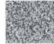
ナチュラルブラック