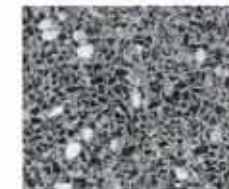
ディーブグリーン

大判 (30cm×60cm) の部材を使用した規則的なパターンで重厚感を演出します。