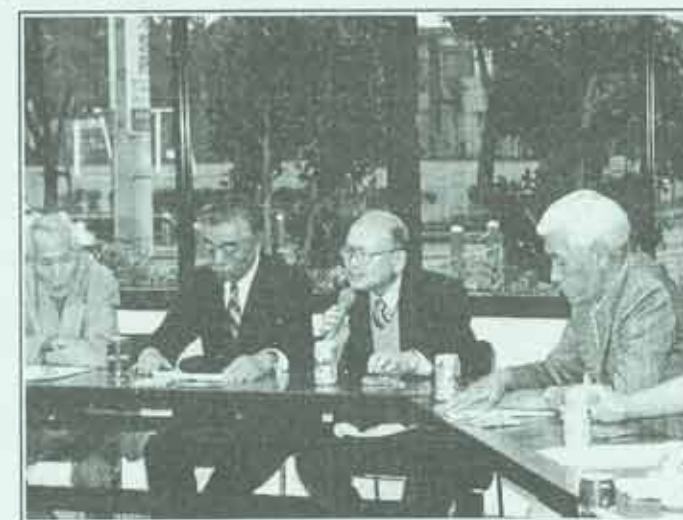
まちづくり連絡会の活動風景

各日とも多くの方の参加を頂き、自分たちの町会、商店街等の点検を行いました。約一時間まちなかを歩いたのち、町会会館等でまちづくり点検図(裏面参照)の作成を行いました。当日の意見として「あらためて自分たちのまちを見ると新しい発見がある」といった声が多く聞かれました。今後はこの点検図をもとに、まちの課題を整理し、まちづくりの方向性を決めていきたいと考えています。