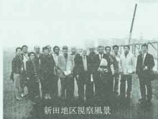
新田地区視察風景

「千住大橋駅周辺地区まちづくり連絡会」が発足してから約半年が経ちました。連絡会では地域の代表の方々とまちづくりに関することについて意見交換等下記のとおり行ってきました。