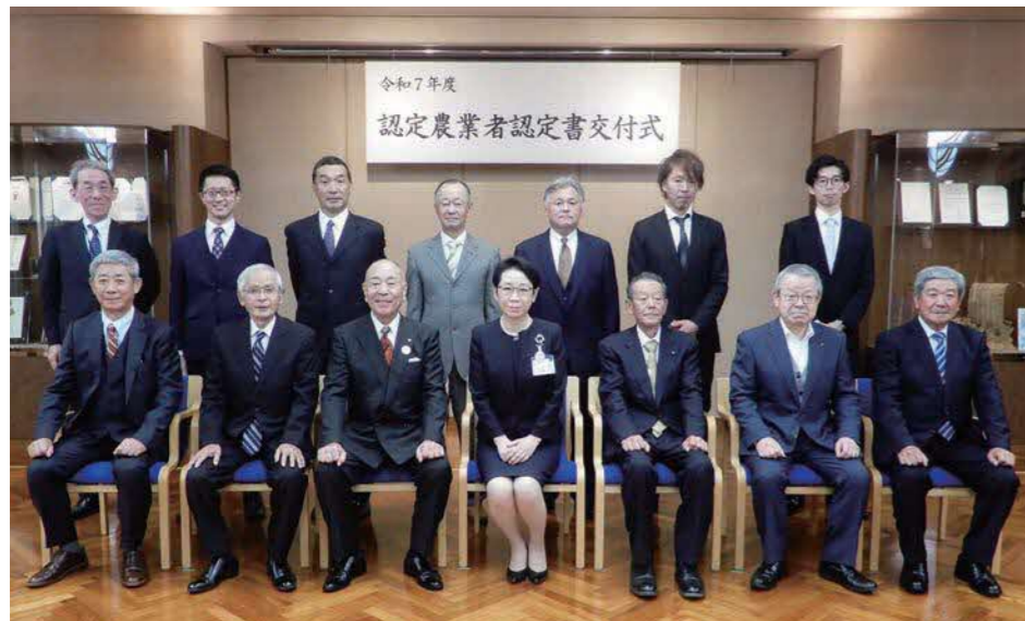
認定農業者 (認定番号順)

令和7年11月21日(金) 区役所にて「認定農業者認定書交付式」が開催されました。今年度は18経営体が認定の更新となり、区長より認定書が交付されました。うち16経営体は家族経営協定を締結されています。