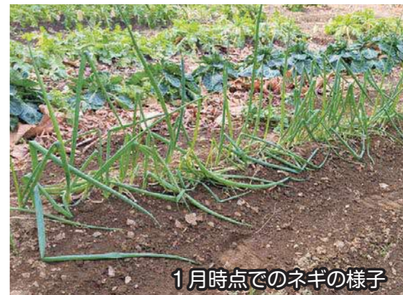
1月時点でのネギの様子

前号では、種の伝達式および種まきの様子を掲載しました。今号では、その後の成長過程として「定植」の様子をご紹介します。夏休み明けの9月から10月にかけて定植を行いました。夏以上に厳しい夏の暑さの影響もあり、生育が思うように進まないなど難しい状況も見られました。それでも、児童たちが水やりや観察など日々の世話を丁寧に続けたことで、無事に定植が可能な大きさまで成長しました。畑では、友達同士で声を掛け合いながら作業する姿も見られ、学びの時間が着実に積み重なっている様子がうかがえました。今後も成長を見守りながら年度内の収穫を目指すとともに、一部は来年度の栽培へと命をつなぐための種取り用として畑に残す予定です。