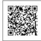
A-mail A-电子邮件 A-메일

("Adachi Public Relations" is also delivered twice a month.) (《足立广报》也每月发送两次) ( ‘아다치홍보’ 도 월 2회 발신)