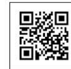
X (former Twitter) X (原 Twitter推特) X (구 Twitter)