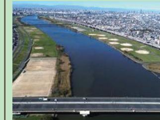
骨格の一部を形成する荒川