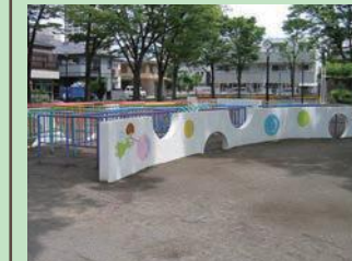
改修した公園の例