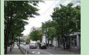
良好な道路景観の例（電大通りのケヤキ並木）