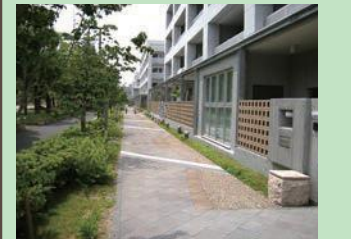
公共団地内の緑化された歩道