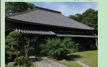
六町いこいの森特別緑地保全地区