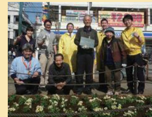
公園等の自主管理