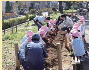
園児との花植え（花畑公園）