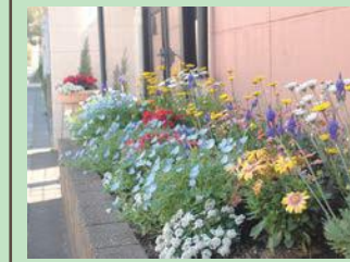
魅力的な個人の庭や玄関先などを認定するビューティフルガーデンの認定事例