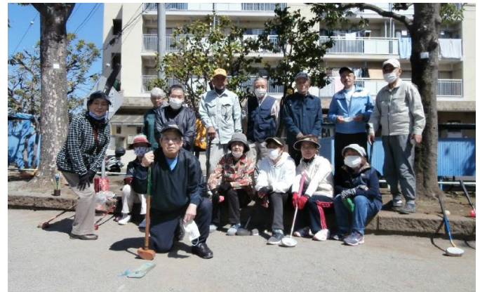
辰沼笑寿会の皆さん