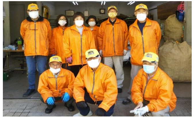
東和寿会の皆さん