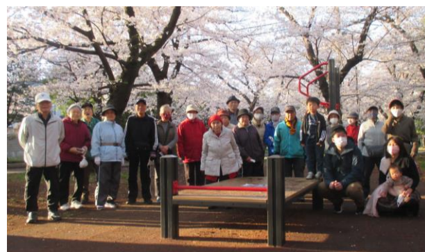
ラジオ体操集会の皆さん