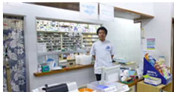
「絆のあんしん協力機関」 入江薬局 地域包括支援センター一ツ家

来店される方も全体的に高齢者が多い中、朝夕や毎食の薬は飲み忘れないようにしていただきたいですが、窓口でもそれが難しそうだなと感じたり、一人暮