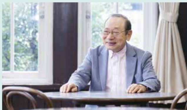
地域に恩返しをしたいと語る肇さん（絆のあんしん協力員）

退職後はこれまでお世話になった地域に恩返しをしたいと思い、ボランティア活動などを通じて地域と深く関わるようになりました。地域活動を始めてからは人の輪がどんどん広がっていったので、立ち上げのことを息子から相談された時は、地域への声かけや場所探しなど、私にできることで協力しました。