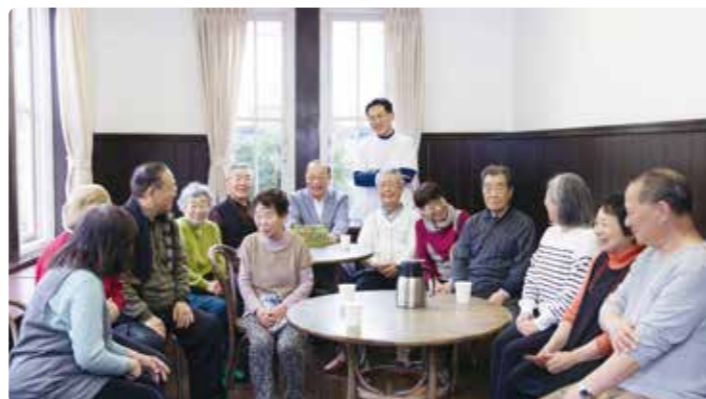
地域の方との交流の様子

突然ボランティアをするというのもハードルが高いと思います。まずは自分が得意なことを活かして始めてみることで、世代を超えた交流なども無理なくこなしていけるとと思います。