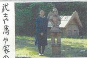
南側には、 レオパールの垣輪 が置かれてい ました。 私と同じ身 長ぐらいの 長ぐらめ

「秋の七草」 （おはぎ）ははな をみかへしな でしんくす ふらばがま あてがほし