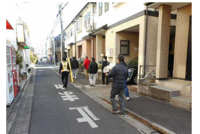
西新井本町3丁目12番付近