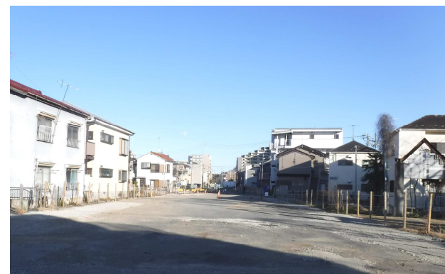
【補助第138号線その2工区の様子】

今後の予定は、令和4年度に電線共同溝の整備、令和5年度に電線の入線、令和6年度に道路整備を行い、令和6年度末の開通を目指しています。