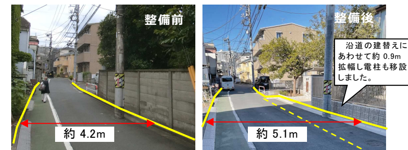
【防災生活道路の整備例 (R3年度整備)】

現在、多くの事業協力のお申し出を受けておりますので、計画的に整備を推進しております。