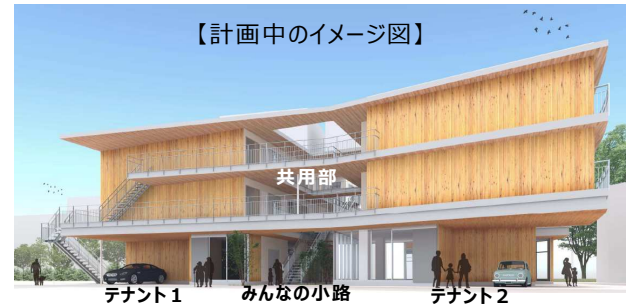
【計画中のイメージ図】

詳しくは、東京都都市整備局市街地整備部防災都市づくり課街路沿道整備担当（電話03-5320-5142）へお問い合わせください。