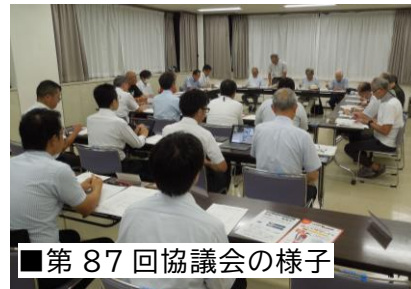
■第87回協議会の様子