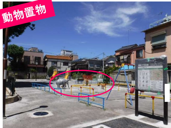
コンクリートアニマルはリアルなペイントに

ここは梅島サファリパーク！リアルペイントの動物たちが集まる、「アフリカの動物公園」をテーマに改修しました。リアルすぎてコワイ？カワイイ？砂場では、砂漠のいきもの探しを楽しめます。