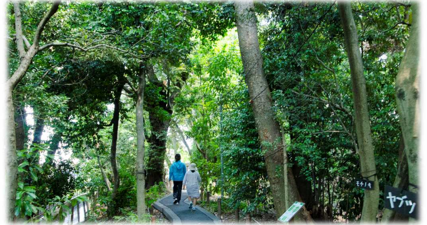
佐野いこいの森緑地内 遊歩道

平成 30 年 3 月 23 日 おしらせ No.94 発行 足立区 編集 都市建設部市街地整備室 区画整理課 〒120-8510 足立区中央本町 1-17-1 TEL 03-3880-5925 FAX 03-3880-5615 メールアドレス kukaku@city.adachi.tokyo.jp