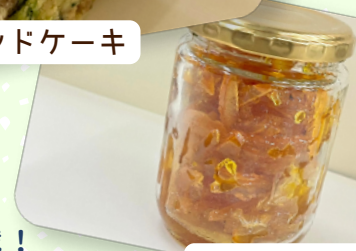
夏みかんのジャム