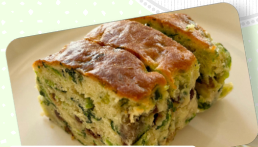
あだち菜のパウンドケーキ