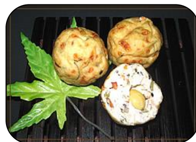
ぎんなん入り京がんも