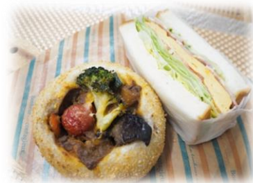
ごろっと野菜のカレーパン &BLTT サンド