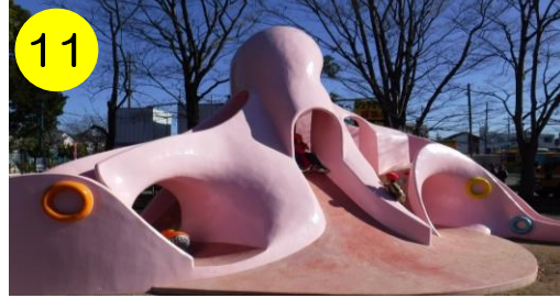
【一ツ家中央公園（一ツ家3-15-1）】 カラフルな吸盤がチャームポイントのタコさん。どう？キュートでしょ？