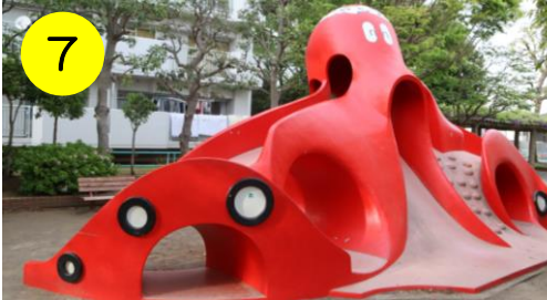
【扇なかよし公園（扇3-9-4）】 小さい公園に巨大なタコさん。興野ふれあい公園のタコさんと兄弟かな？