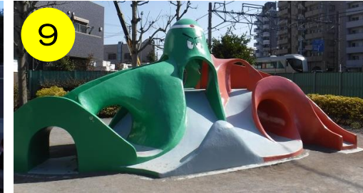
【千住東町公園（千住東2-20-17）】 ツートンカラーなタコさん。電車と一緒に撮れるオススメスポットです。