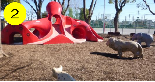
【北鹿浜公園（鹿浜3-26-1）】 タコさんの目の前に、ゾウやライオンが…果たして海と陸の勝負はいかに？