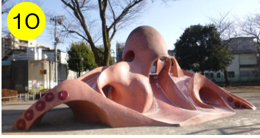
【東谷中公園（東和5-1-9）】 ザ・王道のタコさん。シンプルで飽きのこない親しみやすいデザインです。