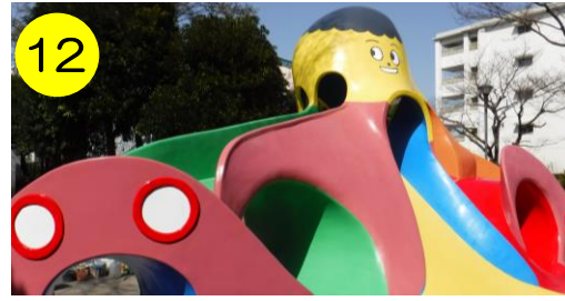
【水神橋公園（保木間5-32-4）】 タコさんデザインコンテストで区長賞「みんなでたのしめる」柄のタコさん。