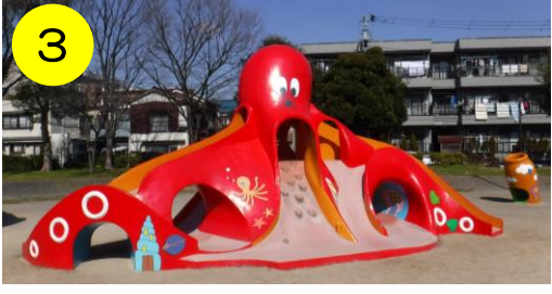
【上沼田北公園（江北7-16-1）】 タコさんデザインコンテストで優秀賞「足立の町を見守り台」柄のタコさん。