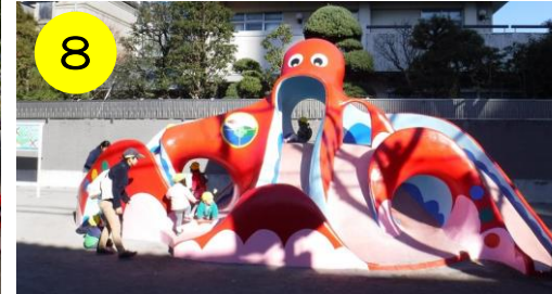
【千住ほんちょう公園（千住4-22-16）】 タコの潜水艦すべり台。窓からはいろいろな海の生きものが見られます。