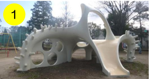
【入谷中央公園（入谷4-16-1）】 区内唯一のイカすべり台。アニメ映画にも登場しそうな存在感です。

区内には、 11体のタコさんと1体のイカさん のすべり台があります。一口に「タコさんすべり台」と言っても、どれも個性的でまったく一緒のものはありません。区内に散らばるタコさんとイカさんに、会いに行ってみませんか？