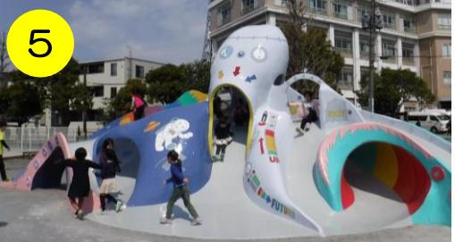
【新西新井公園（西新井5-17-1）】 生まれ変わった元祖タコさんすべり台。その名は「飛べ！タコ星人ロケット！」