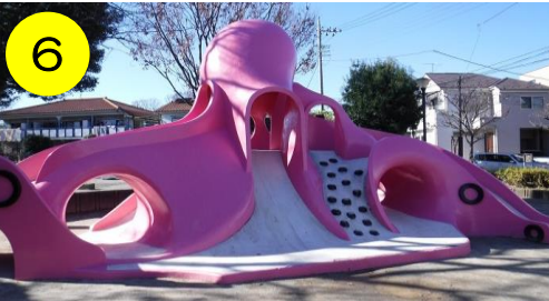
【興野ふれあい公園（興野2-28-25）】 ピンクが眩しいタコさん。あれれ？何処かで見たことがあるような… →