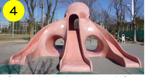
【上沼田東公園（江北6-10-1）】 区内で一番コンパクトなタコさん。小さくても楽しさは変わりませんよ！