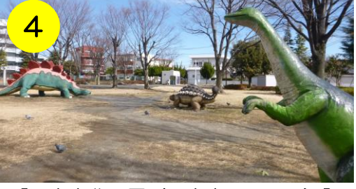
4 【堀之内北公園 (堀之内1-21-1)】 公園に3匹の恐竜が現れた! もしかして、みんなと一緒に遊びたいのかな?