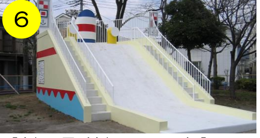
6 【島根公園 (島根2-14-22)】 大きな船のすべり台。さあ、航海に出てみよう! 海の生き物に出会えるかも。