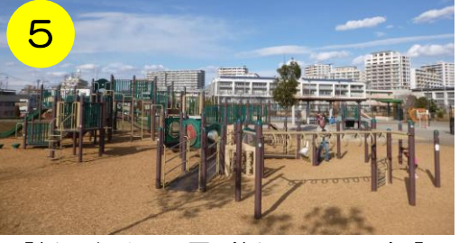
5 【新田さくら公園 (新田3-34-1)】 とても大きな複合遊具です! 一部車イスの方も楽しめるようになっています。