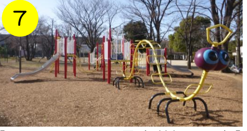
7 【五反野コミュニティ公園 (西綾瀬2-1-18)】 ニョキニョキ…遊具から巨大ムカデが出てきたぞ! どこか憎めない愛らしさ。