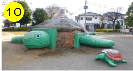
10 【東保木間公園 (東保木間2-13-1)】 公園を優雅に泳いでいる亀の親子。大人の亀はすべり台になっています。