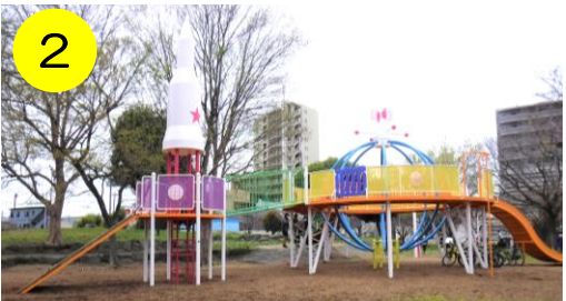
2 【入谷日の出公園 (入谷1-3-1)】 足立区にも宇宙ステーションが?! 近くには宇宙人と思しき石像も…