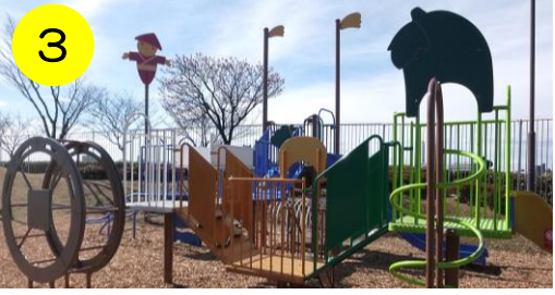
3 【都市農業公園 (鹿浜2-44-1)】 野菜や水車等の農業がモチーフの遊具。遠くからでも見える“かかし”が目印!