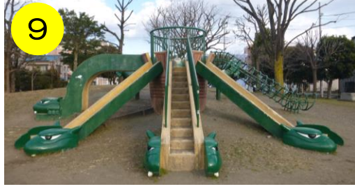
9 【八十町公園 (保木間1-34-15)】 伝説の生き物“ヤマタノオロチ”が! でも、襲いませぬのでご安心ください。