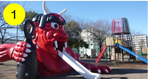
1 【舎人いきいき公園 (舎人6-3-1)】 今にも動き出しそうな鬼のすべり台！他にもおとぎ話をイメージした遊具が。