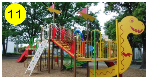
11 【陣川戸公園 (保木間5-17-1)】 船でタイムスリップした先は…なんとジュラ紀! 恐竜に気をつけて冒険だ。