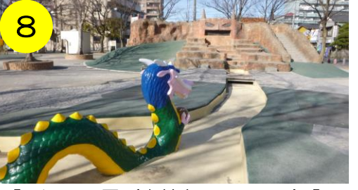
8 【下河原公園 (東綾瀬1-11-12)】 ドラゴンが向かう先に…鬼の岩山が! 岩山を登るとすべり台が現れます。