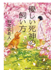
『優しい死神の飼い方』 知念実希人 / 著 光文社文庫

総勢20名 足立区立第一中学校の 図書委員を取材。 おすすめの本を 教えてもらいました!