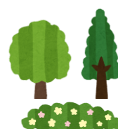
オープンスペースの整備や緑道の設置等 (※収入を得る目的で整備する事業は対象外)