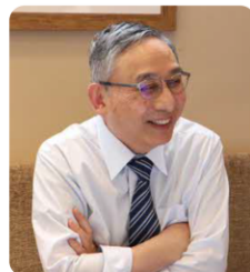
昭和女子大学名誉教授

全国の自治体で最も応募が多いということは、とても素晴らしいです。 これは親御さんや先生方、教育委員会の協力がなければ実現しません。 今後も他の自治体のお手本として、足立区のコンクールが盛り上がっていくことを楽しみにしています。