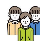
写真 や イラスト を入れて、見やすくすること