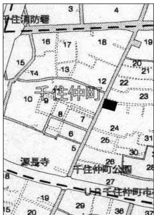
地図：古久屋の現在地