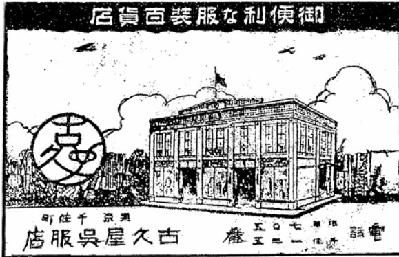
上：古久屋の外観 下：古久屋の広告

部宿」の半纏を着た人や、神職が写っており、九月に行われる仲町氷川神社の祭礼に際して撮影したとみられる。旧日光街道に面した場所に洋風二階建ての立派な建物が写っているが、画像が暗く、ややわかりにくいので当時の広告イラストも掲載する。二つを比べてみると、近代的な古久屋の外観がよくわかるだろう。