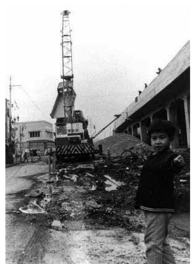
綾瀬駅の高架化工事 撮影年不明

た。昭和四十一年（一九六六）に着工し、昭和四十七年に綾瀬一代々木公園間が、昭和五十三年（一九七八）に代々木公園一代々木上原間が開通し、実に十二年の歳月をかけて全通に至りました。その後、昭和五十四年には北綾瀬駅が開業し、現在の東京メトロ千代田線と同じ路線となりました。