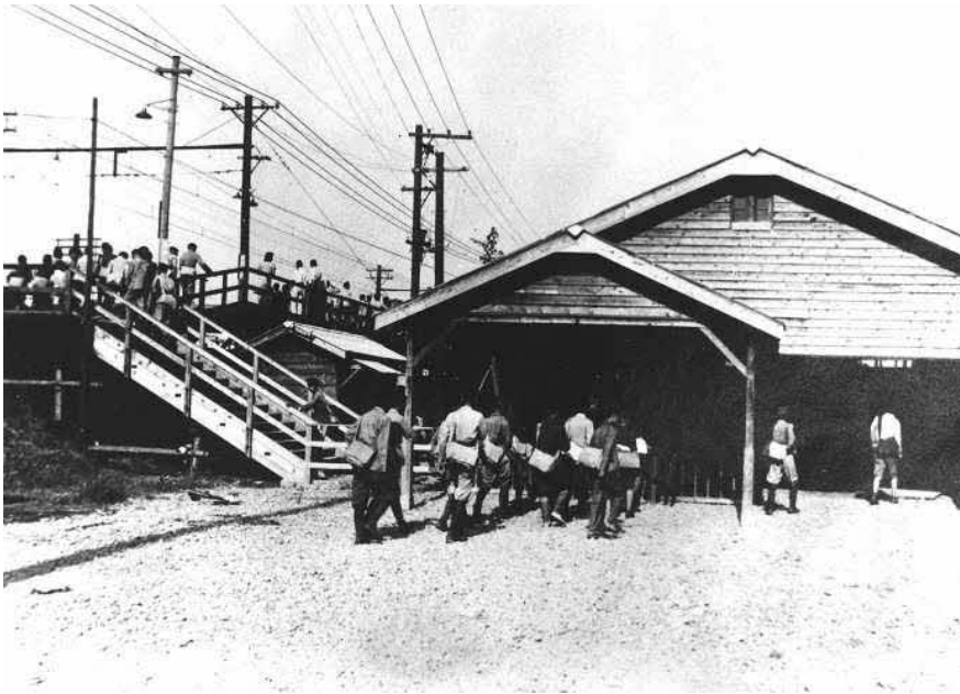
開業初日の旧綾瀬駅昭和18年（1943）

足立史談六九二号にて、アヤセカメラ（綾瀬三一―一〇）さんよりご寄贈いただいた写真資料「アヤセ