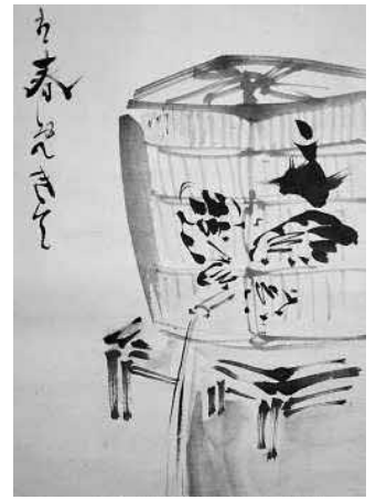
図2 酒樽に記された「文」と蝶の絵による署名部分