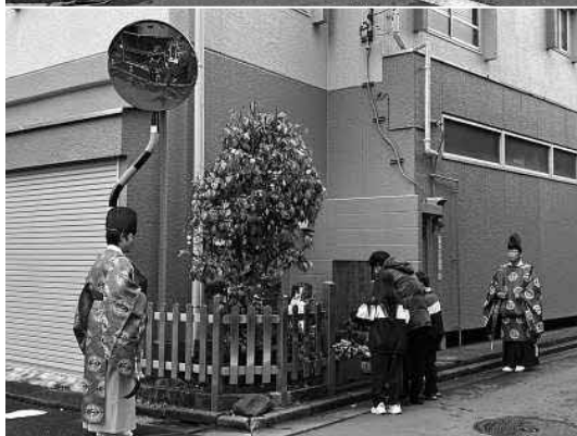
移動して二か所の庚申塔で祭事が行われる。