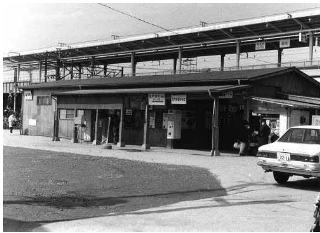
高架化工事中の仮綾瀬駅舎 昭和44年 (1969)

況を踏まえて輸送力強化と混雑緩和を意図したもので、常磐線の複々線化（上下線各二本の合計四本にする）と併せて計画されました。 この折に、綾瀬駅は亀有方面に二〇メートル移転して現在と同じ立地となり、高架化工事も行われまし