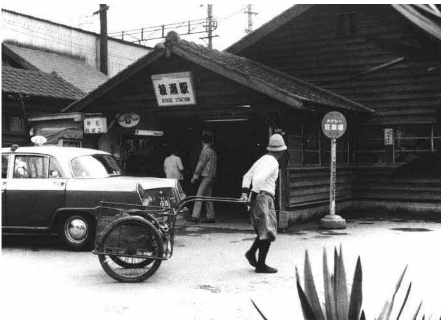
旧綾瀬駅舎撮影年不明

カメラ・コレクション」を紹介しました。今回は、綾瀬駅の変化を捉えた写真をピックアップし、鉄道関係の雑誌なども参照しながら、綾瀬駅のあゆみや、期待された役割を辿っていきます。