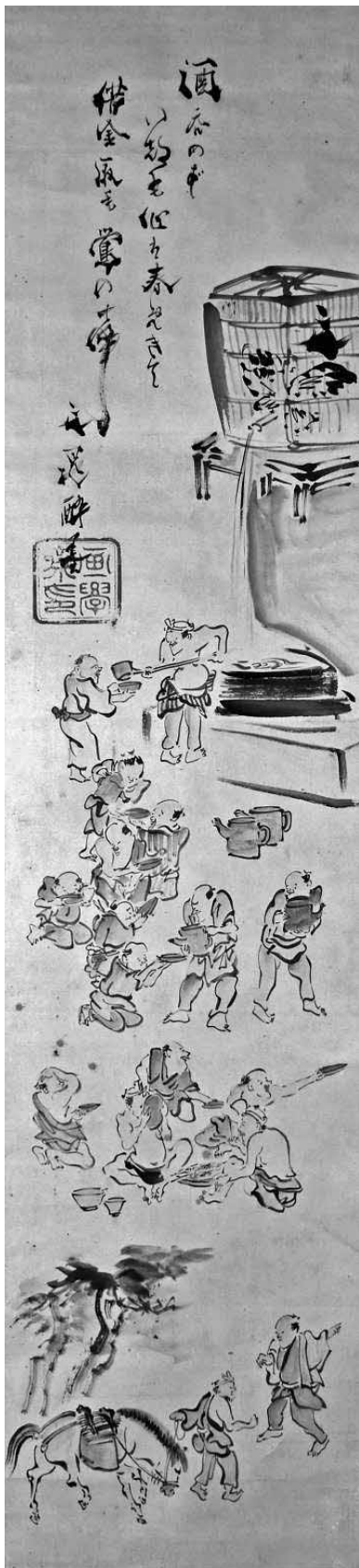
図1 谷文晁「酒宴図」 文化14年(1817)以降 紙本淡彩 当館蔵

郷土博物館では、酒井抱一や谷文晁といった地域ゆかりの絵師たちに対する調査を続けています。その調査は、地域の各家々の伝来資料や記録に対する検証を基本としつつ、各地に所在する美術作品の情報を広く持つ古美術商の方々からも適宜情報を集め、知られざる地域ゆかりの作品の探索も行っています。そして令和五年（二〇二三）、古美術商の保管する作品を調査する過程で、千住の酒合戦に由来する谷文晁の作品「酒宴図」（図1）が新たに発見され、令和七年、郷土博物館の所蔵となりました。そこで今回は、この新発見の地域ゆかりの美術作品