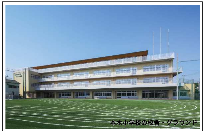
本木小学校の校舎・グラウンド