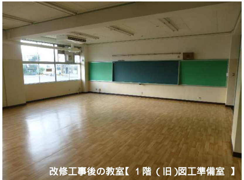
改修工事後の教室【 1 階（旧）図工準備室 】

最後まで安全を第一に工事を進めていきますので、引き続きご理解とご協力をお願いいたします。