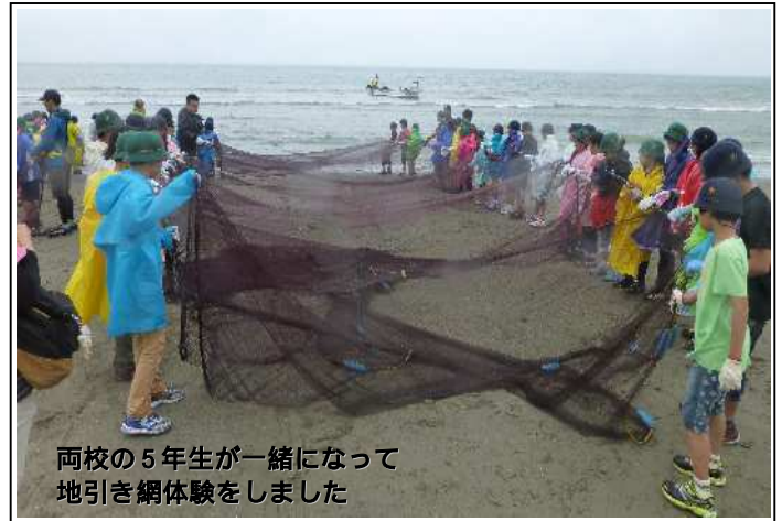
両校の5年生が一緒になって地引き網体験をしました

今後もいろいろな交流事業を行いながら、平成27年4月の統合に向けた子どもたちの関係づくりを進めていきます。