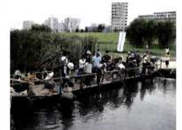
▲あらかわ自然体験デーの様子

上流部約400mについては、22年3月までに草地系の広場として整備していきます。整備に際して事前に工事説明会を開催する予定です。