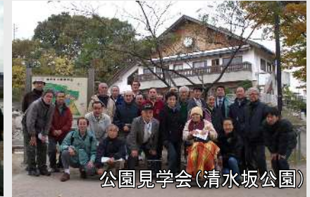
公園見学会（清水坂公園）