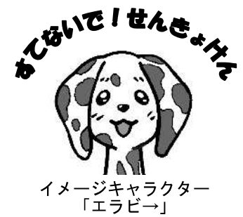
イメージキャラクター「エラビー」