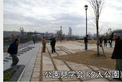
公園見学会（汐入公園）