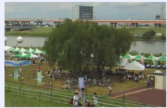
スーパー堤防（あだち自然体験デー）