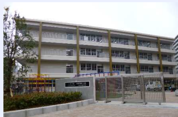
新田学園第二校舎