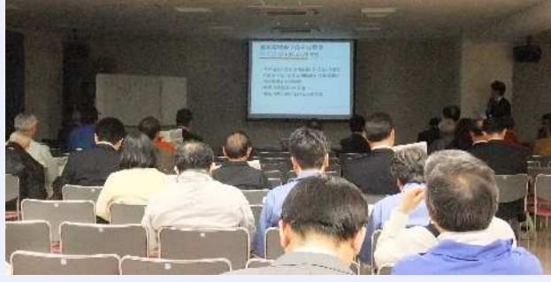
説明会風景（新田学園）

平成25年4月に新田橋架け替え経過報告会を開催し、下記のとおり北区との確認事項及び平成25年度の検討内容を報告しました。説明会で報告した内容は、下表のとおりです。