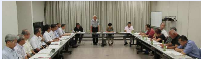
まちづくり連絡会風景