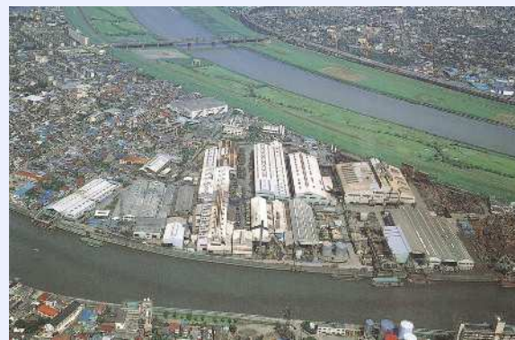
開発前の新田三丁目周辺